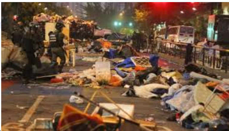
Desmantelamiento de campamento frente a sede del PNUD (ONU), 8-05-2014

En horas de la madrugada, aproximadamente a las tres (3) de la mañana del ocho (8) de mayo de 2014, funcionarios de la Guardia Nacional Bolivariana en conjunto con la Policía Nacional Bolivariana realizaron un operativo para desalojar las plazas en Caracas, en el cual participaron más de 1500 efectivos militares y policiales, arrestando a todas las personas que estaban allí esa noche durmiendo.