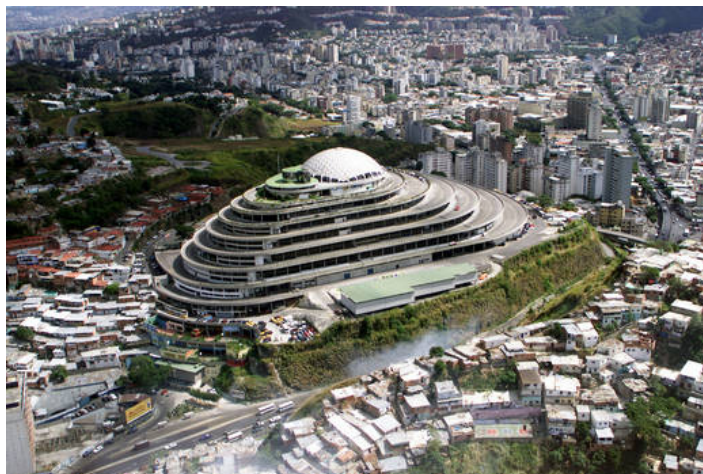
El Helicoide (Centro de reclusión SEBIN, Caracas, fundamentalmente de privados de libertad por motivos políticos)