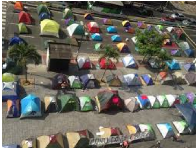
Campamento ubicado en la Av. Francisco de Miranda, Altamira, Caracas, frente a la sede del PNUD (ONU)

En horas de la madrugada, aproximadamente a las tres (3) de la mañana del ocho (8) de mayo de 2014, funcionarios de la Guardia Nacional Bolivariana en conjunto con la Policía Nacional Bolivariana realizaron un operativo para desalojar las plazas en Caracas, en el cual participaron más de 1500 efectivos militares y policiales, arrestando a todas las personas que estaban allí esa noche durmiendo.