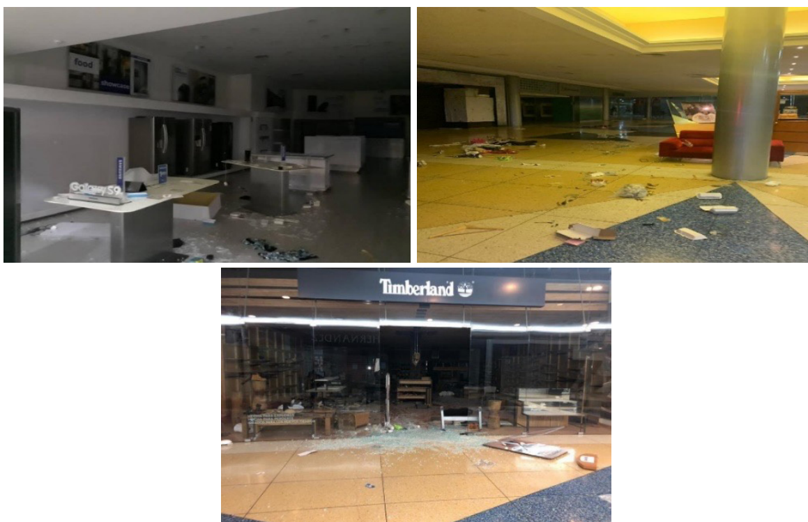
Daños en algunos establecimientos comerciales saqueados en centros comerciales del estado Zulia