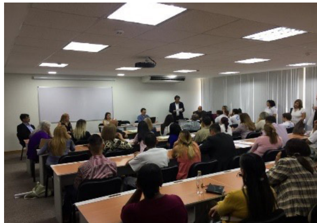
Reunión del equipo técnico de la ONU y equipo del Foro Penal con familiares y víctimas, en Caracas, el 19/03/2019

Se espera un informe definitivo sobre la situación de los derechos humanos en Venezuela, y, eventualmente, una visita personal de la Alta Comisionada, Michelle Bachelet.