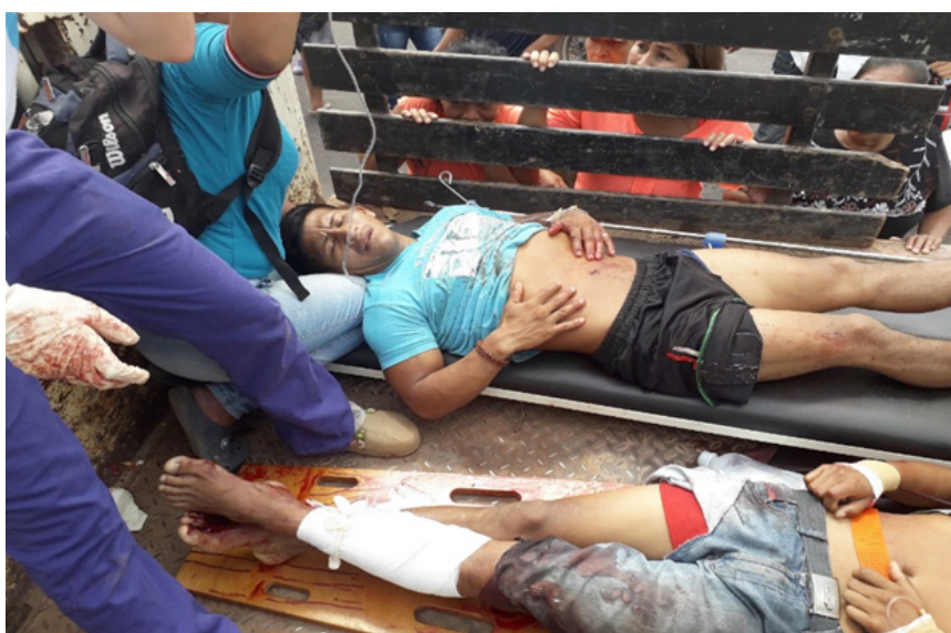
Heridos de Canaima en diciembre de 2018