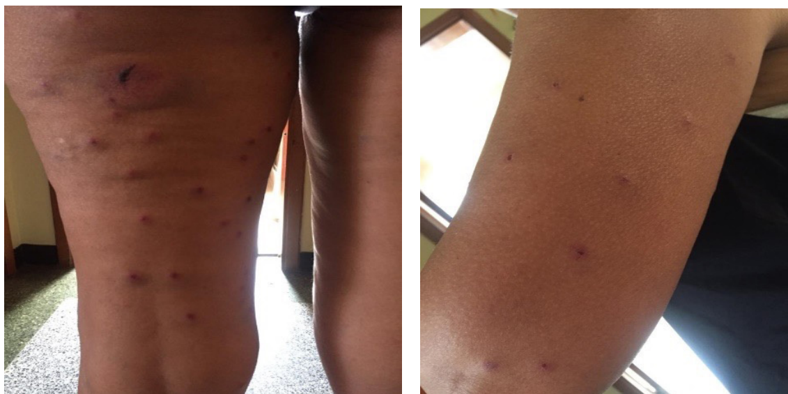
Herida de perdigón en las piernas y el brazo, el 30/04/2019 en Caracas