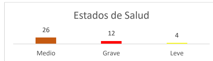
Niveles de estados de salud, de los presos políticos verificados por el Foro Penal

Particularmente, 12 de los 42 presos políticos que se han verificado, tienen cuadros de salud graves (29%), 26 presentan cuadros de salud medio (62%) y 4 reportan estados de salud leve (10%), tal y como puede verse en los gráficos sucesivos: