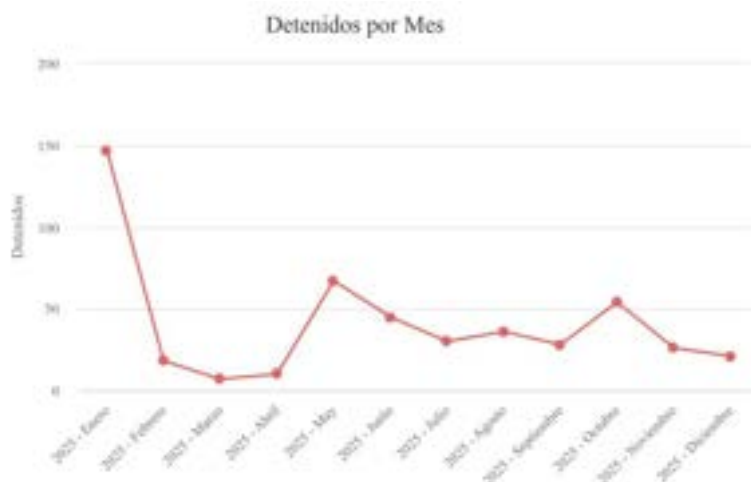
Detenciones con fines políticos por mes (año 2025)

En cuanto a las detenciones con motivos políticos por estados, a continuación, se presenta un gráfico con la distribución geográfica de las detenciones arbitrarias registradas en Venezuela a lo largo del período analizado. En él se refleja la cantidad total de personas arrestadas por entidad federal, permitiendo identificar los principales focos de represión y las zonas con mayor incidencia de violaciones a la libertad personal por motivos políticos: